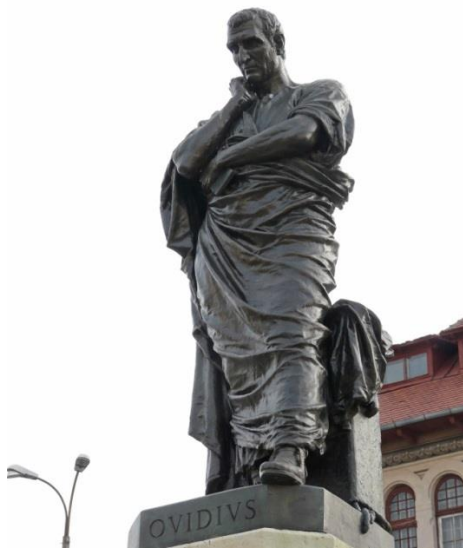
Statuia poetului Ovidiu, Constanța

În România, numele Ovidiu este purtat cu trimitere la Publius Ovidius Naso, un poet exilat la Tomis Constanța de împăratul Augustus. Poate că a venit momentul ca în tradiția creștină de veacuri, credincioșii să se orienteze pentru onomastică spre acest sfânt al Bisericii primare, vrednic bărbat apostolic și mucenic.