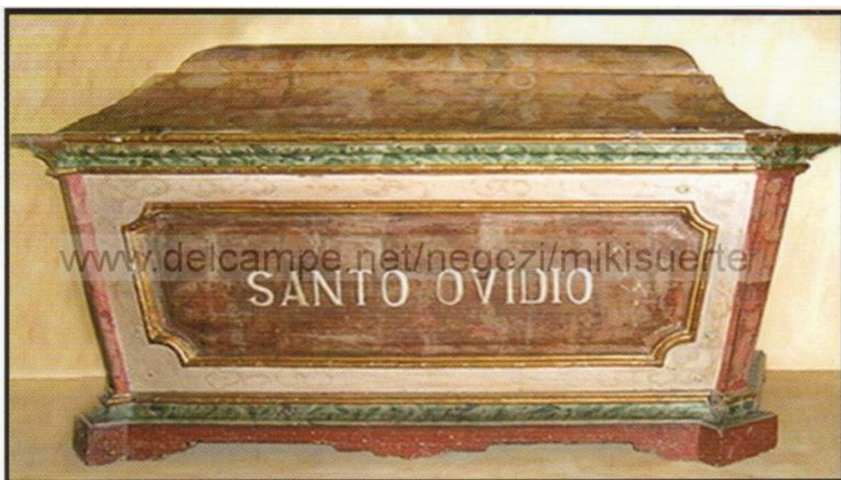
SARCOFAGO DI S. AUDITO (OVIDIO) VESCOVO E MARTIRE DI BRAGA CATTEDRALE DI BRAGA - PORTOGALLO

Racla cu moaștele sfântului, catedrala din Braga, Portugalia